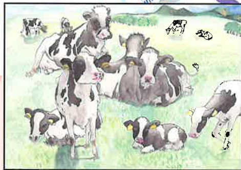
前年度 優秀賞 (栃木県農政部長賞)