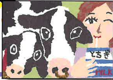
前年度 特別賞 (栃木県学校給食会理事長賞)