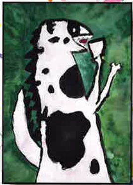
前年度 特別賞 (下野新聞社賞)